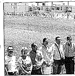
La Junta recepciona la obra.

Las obras de acondicionamiento del campo de fútbol de Benahadux han concluido y ayer se llevaba a cabo el acto administrativo entre la empresa Construcciones Tejera S.A. y la consejería de Turismo y Deportes de la Junta de Andalucía para la recepción de la obra que próximamente será definitivamente entregada al Consistorio.