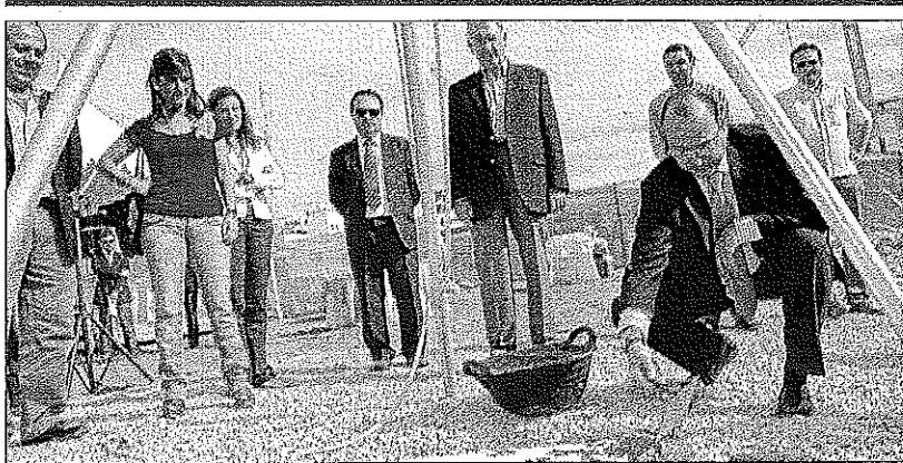
PRIMERA PIEDRA DE LA OCTAVA PROMOCIÓN DE VPO DE 'ALMERÍA XXI'

Explica Megino que ya son muchos los que están acudiendo hasta el Ayuntamiento para solicitar su admisión en el registro, por lo que se ha tomado esta decisión de arrancarlo de forma manual. Además, añade el edil que de momen-