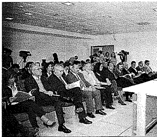
La sede del PITA en la UAL se llenó de autoridades.

Además, hizo hincapié en el informe 'Evaluación del impacto socioeconómico del Parque Científico-Tecnológico de Almería', elaborado por Unicaja, que se presentó a la sociedad el pasado 12