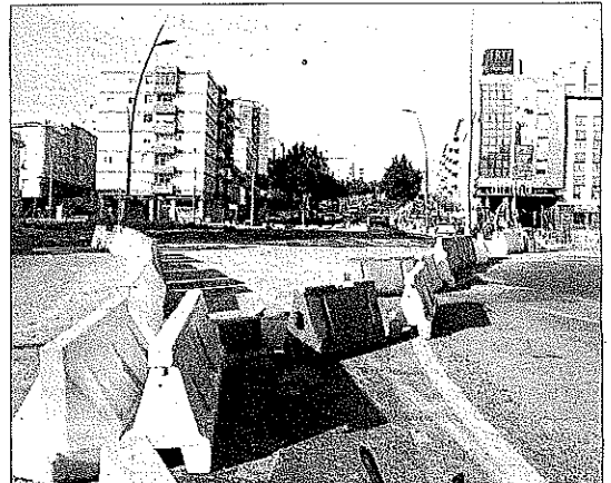
■ Situación actual de las obras de soterramiento.

Hasta ahora el cruce entre la Carretera Níjar-Los Molinos y la Avenida del Mediterráneo estaba regulado por semáforos y en el futuro éstos desaparecerán, con lo que se pretende que la circulación sea mucho más fluida, tanto por una como por otra vía, que son de las más utilizadas por los automovilistas para entrar y salir de la ciudad.